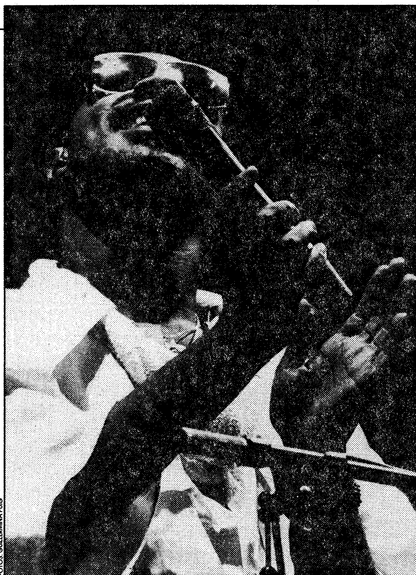
Stevie Wonder, durante su recital en la plaza de toros La Monumental de Barcelona, realizado el mes de agosto de 1984. Wonder convirtió aquel concierto en un acontecimiento ciudadano