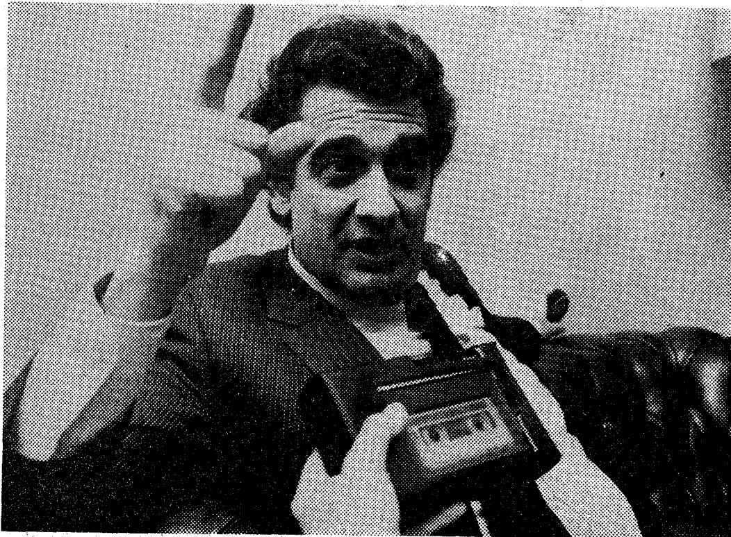
El tenor Plácido Domingo se muestra disconforme con algunas críticas sobre su actuación del lunes pasado

Comentamos que hay sectores de público amantes del agudo, del «pinyol», y que hay quien piensa que Plácido Domingo no tiene su fuerte en los agudos. Precisamente el lunes, los agudos tal vez fueron lo que mejor canté. Yo no soy un cantante de agudos, yo canto toda la obra, pero si algo