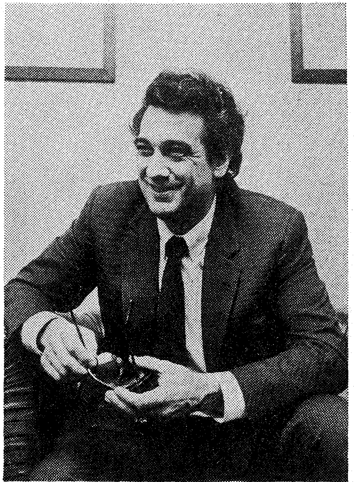
«El Liceo tiene que ser uno de los más grandes teatros de ópera del mundo».

La nueva etapa en el coliseo de las Ramblas va a facilitar las cosas. Se está haciendo un esfuerzo digno de aplauso y de apoyo. El Gran Teatro del Liceo no sólo debe ser grande porque lo diga en nombre, sino de hecho. Tiene que ser uno de los más grandes del mundo. Sin duda, es el Gran Teatro de España, el número uno en ópera que tenemos en España, y debe tener la categoría artística mundial que se merece. Creo que se va por el buen camino. Se ha traído a un maestro de coro excepcional como es Gandolfi, se percibe la calidad del Coro y de la Orquesta, el trabajo es menos sobrecargado, todos laboran más a gusto... Y estoy muy ilusionado en poder grabar actuaciones en video, como he hecho en Londres y Milán. En septiembre u octubre haremos esta «Tosca» y vendrán más cosas en colaboración con el Liceo.