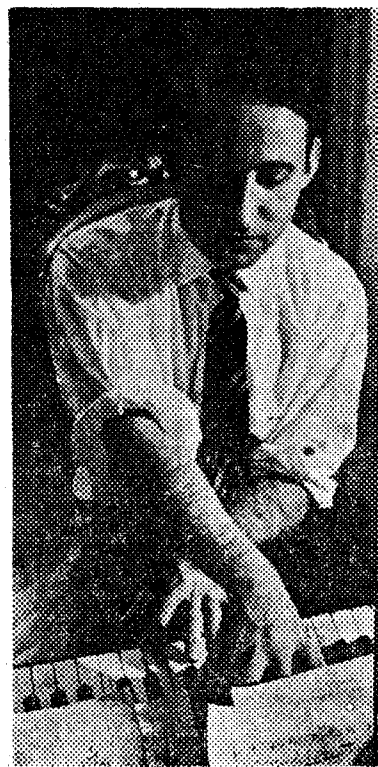
El clavecinista Rafael Puyana en un ensayo

● Miércoles: Tarde, a las 8.30, los «Miércoles de Radio Nacional», concierto retransmitido en directo desde la iglesia de San Felipe Neri por FM. Presentación del Yubal Trio con dos obras de Beethoven, la opus 1 para esta formación instrumental, y la opus 97. Noche en el Palau: Recital del clavecinista Rafael Puyana (para estudiantes, organizado por la Escuela de Ingenieros Industriales).