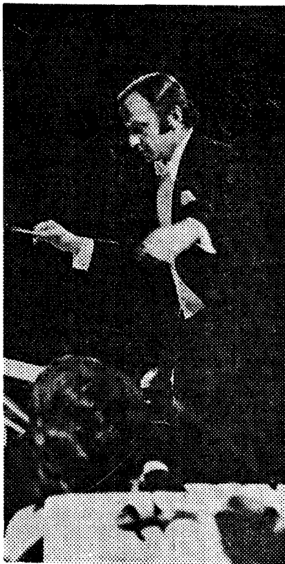
El director Gerd Albrecht

Siguen, mientras, los conciertos sinfónicos. El más relevante corrió a cargo de Gerd Albrecht, actual titular de la Ópera de Berlín, desde que abandonó el puesto Lorin Maazel. Se presentaba en Madrid. En el ciclo de la Orquesta Nacional. Y obtuvo de ella un rendimiento sencillamente extraordinario, con especialísimos aciertos de to-