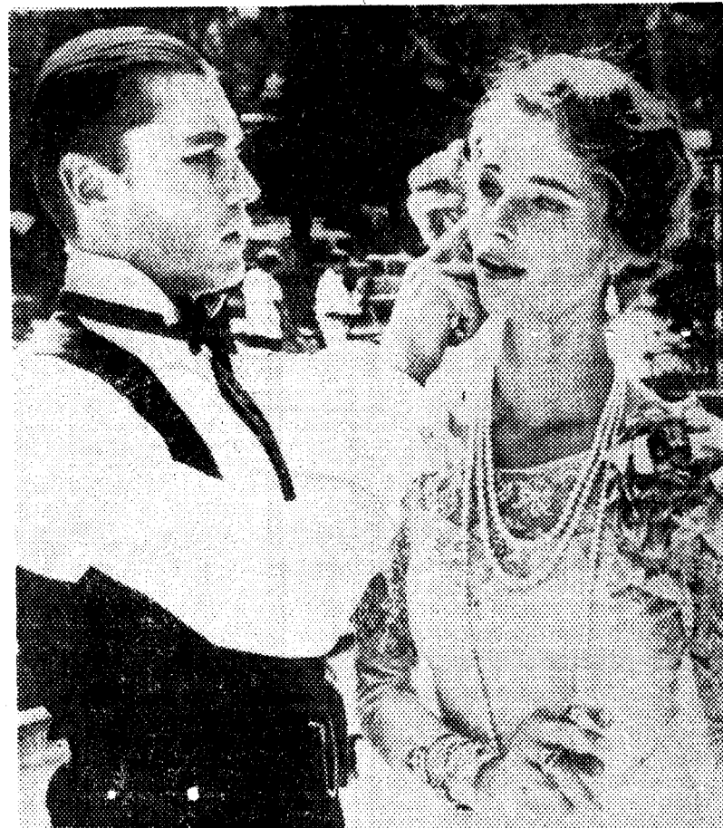
PRINCIPIO DE RODAJE El galán austriaco Helmut Berger le coloca un pendiente a la actriz británica Charlotte Rampling momentos antes de iniciarse el rodaje de una secuencia de la cinta «Los malditos» que dirige Luchino Visconti.

Los abonos para la «Semana» se hallan a disposición de los aficionados en la sección de Caja de «Aixelá» (Rambla de Cataluña, 13). Como de costumbre, habrá un servicio especial de autobuses al final de las sesiones de noche.