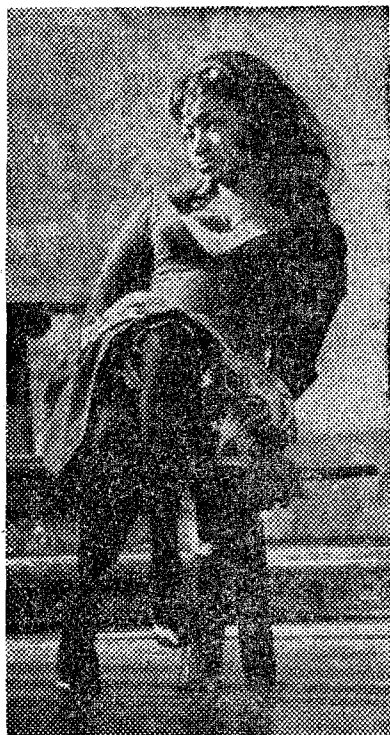
La sugestiva «Carmen» de Grace Bumbry. La mezzo norteamericana haría sin duda una «Bess» sensacional en la ópera de Gershwin