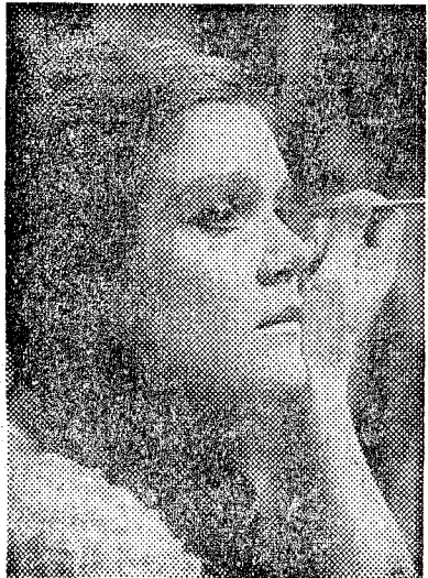
Anja Silja. No la veremos en su creación de «Lulú» pero sí en la «Salomé» de Strauss, un papel idóneo para ella

«La próxima temporada de otoño-invierno en el Liceo está determinada ya en líneas generales». Esto es lo que nos dice don Juan Antonio Pamiás al preguntarle sobre sus futuros proyectos respecto al venidero período operístico del teatro. Nos dice esto y poca cosa más, porque considera prematuro dar por segura la realización de algunos