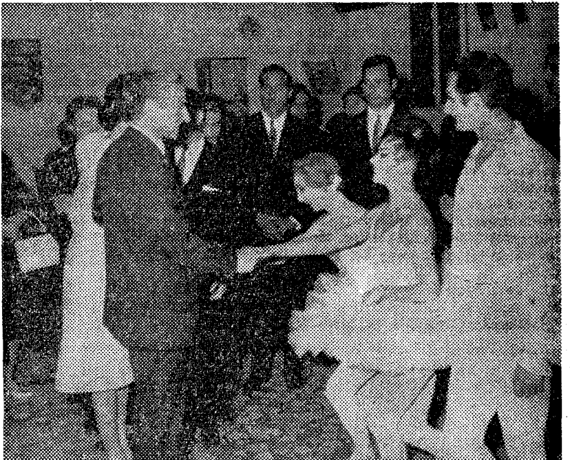
Después de una actuación del «Ballet Classique de France» en Teherán, el Sha de Persia felicita a los primeros bailarines de la compañía

La temporada de «ballet» que se prepara para el mes de abril será compartida por dos compañías. Una, el «Grand Ballet Classique de France», actuará durante, aproximadamente, una semana y la otra, el Ballet de la Ópera del Estado de Praga, permanecerá en el Liceo durante más tiempo para ofrecer un buen número de representaciones.