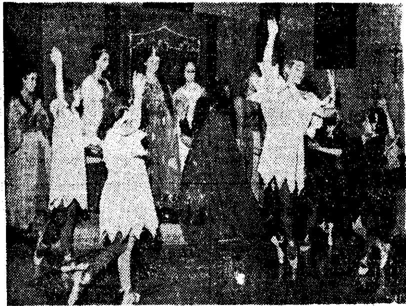
Un coro angélico de la representación navideña, según «El pesebre», de Sor Inés de Montalt, dado en la iglesia gótica de San Vicente de Montalt

A la representación, en la que intervinieron «actores amateurs» de la locali-