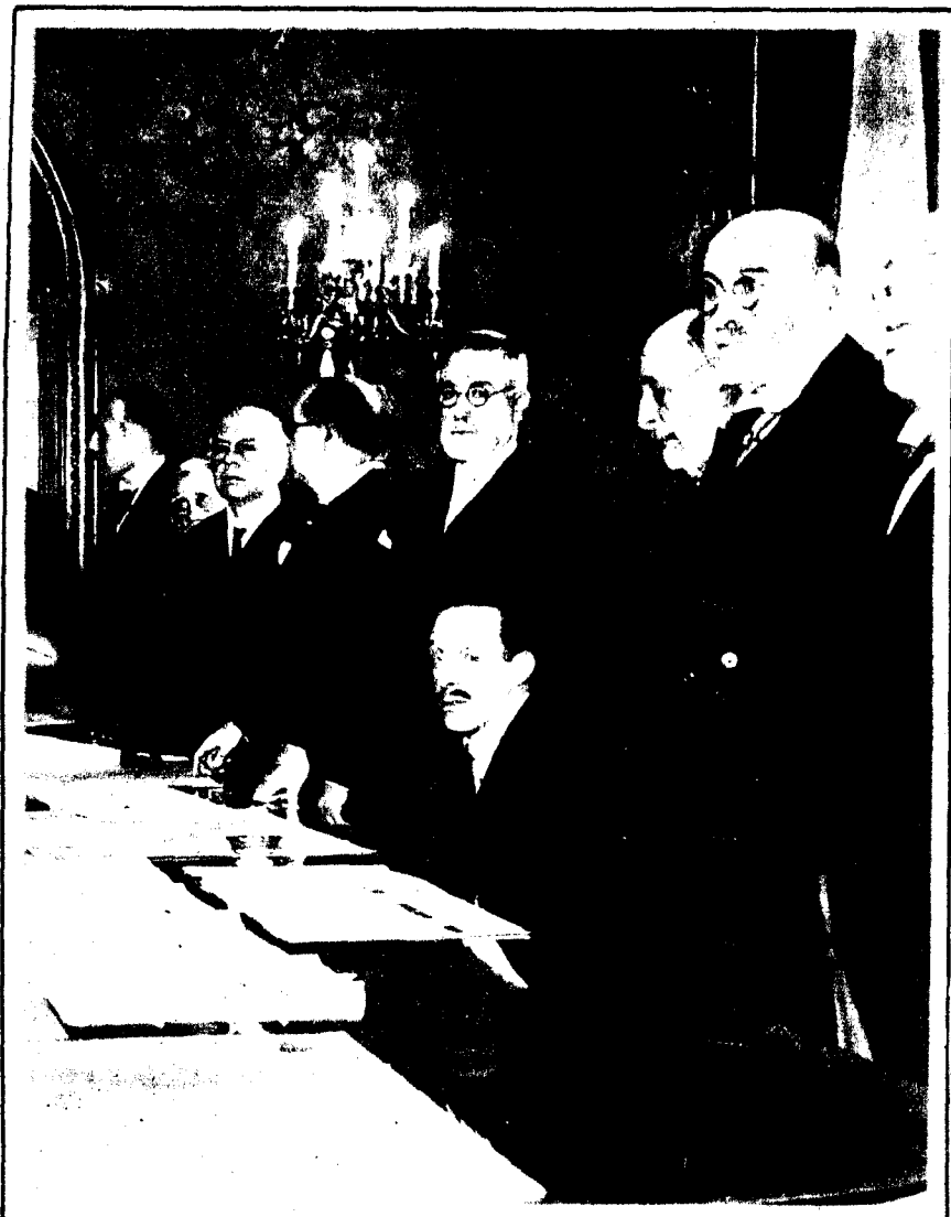
S. M. el Rey examinando los planos del proyecto definitivo de la Zona Franca, en el Salón de Juntas del Consorcio