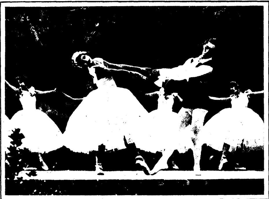
El cuerpo de baile del Liceo en la fiesta del Romanticismo, celebrada en los jardines del marqués de Alfarrás (Horta), con asistencia de la Real Familia