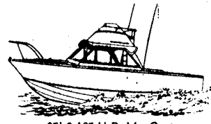
25' 2-165 H.P. MerCruiser

También disponemos de modelos en 20' y 28' y diferentes versiones en Sport Fisherman, Cabin Cruiser, Convertible Sedan, Bahía Mar, Flybridge Cruiser, etc.