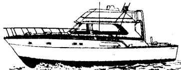
46' 2-8/71 General Motors Diesel