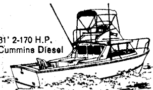
31' 2-170 H.P. Cummins Diesel