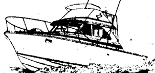
35' 2-210 H.P. Cummins Diesel