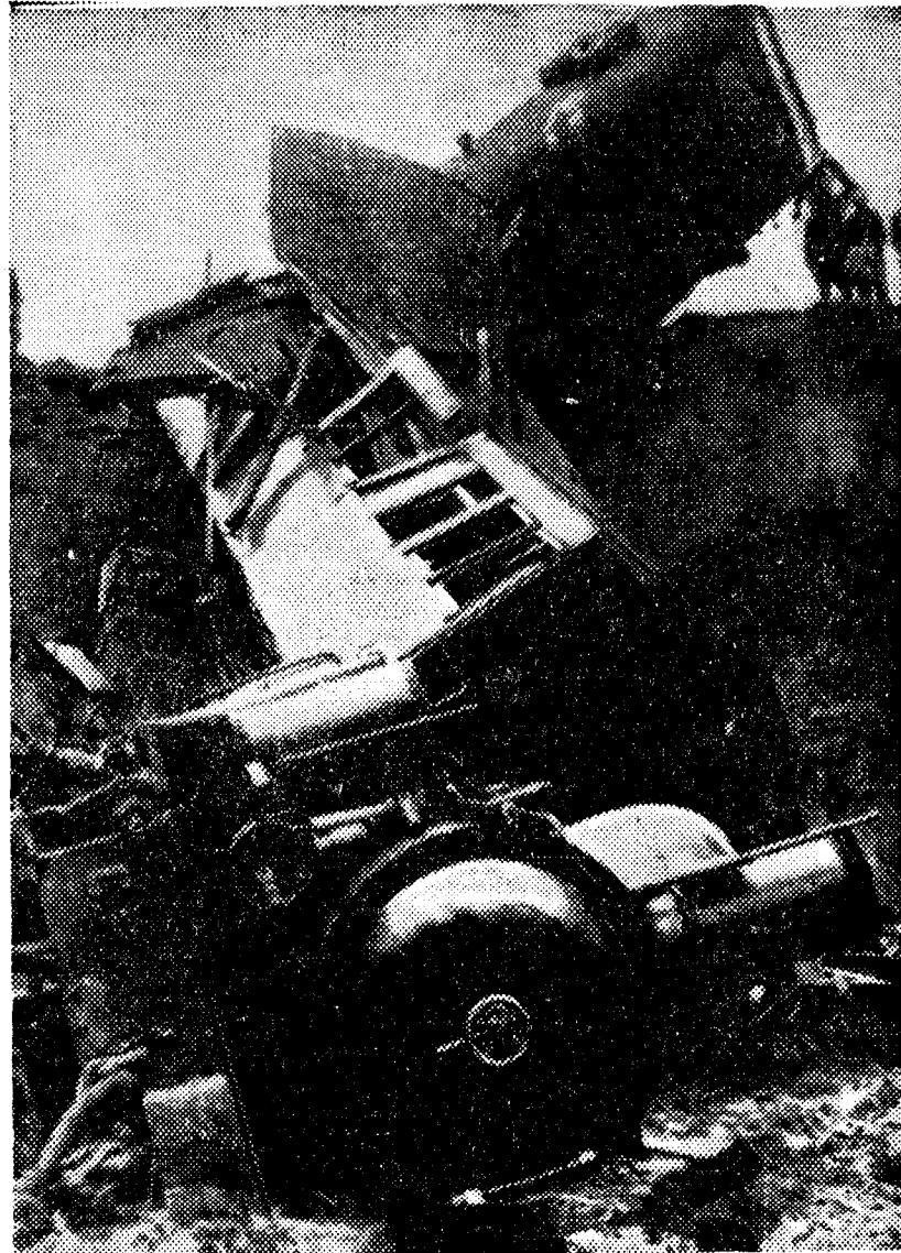
He aquí el aspecto que ofrecía el tren portugués que ha descarrilado a 260 kilómetros al noroeste de Lisboa. El accidente, en el que murieron tres personas, es el tercer siniestro ferroviario lusitano que se registra en las últimas cuatro semanas.