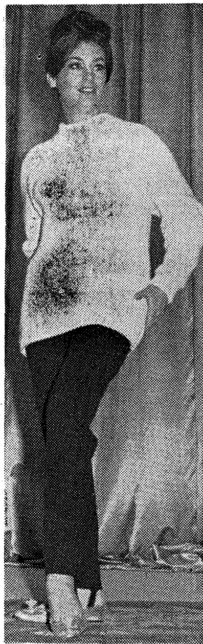
Mallas elásticas, mangas raglán y cuellos altos de cisne presenta este jersey blanco exhibido en el «III Salón Nacional de la Confección»