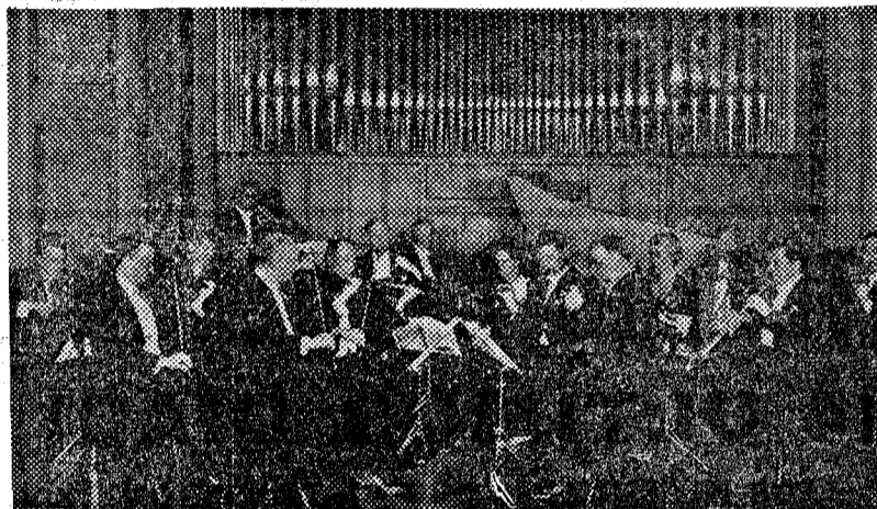
El conjunto instrumental de la «Schola Cantorum» de Basilea

El «Forum Musical», organizador junto con el Instituto Alemán de Cultura de periódicos conciertos en el Palacio de la Música, dedicará el último del presente ciclo a la música antigua, presentando un grupo instrumental de la Suiza alemana: la orquesta de cámara formada bajo la dirección del doctor August Wenzinger, por profesores del Instituto «Schola Cantorum Basiliensis», dedicado desde el año 1933 en que se fundó, al estudio y divulgación de las obras más representativas o menos conocidas de los siglos XVII y XVIII. Como es lógico, el programa de esta audición que tendrá lugar hoy, sábado, por la noche, comprende obras de especialización: dos «Suites», de Purcell y J. S. Bach, y tres «Conciertos» para varios instrumentos solistas de Telemann, Pergolesi y Haendel.