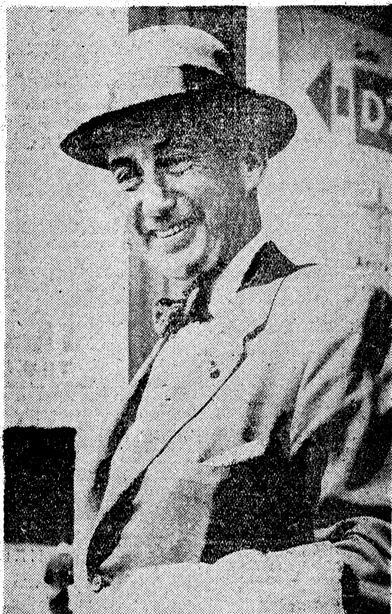
El presidente electo de los Estados Unidos, Kennedy, ha ofrecido al famoso político demócrata Adlai Stevenson, a quien vemos en la foto, el cargo de delegado de los Estados Unidos en la O. N. U., desempeñado durante la Administración republicana por Henry Cabot Lodge. Stevenson ha pedido unos días para estudiar el asunto, en espera de conocer el titular del Departamento de Estado.