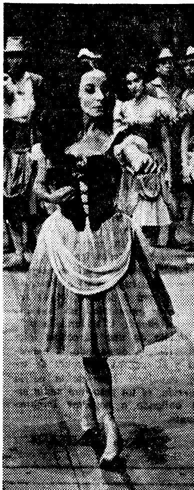
La Giselle de Alicia Alonso

La temporada terminará (del 3 al 9 de mayo) con seis funciones a cargo del Ballet Nacional de Cuba. Su presentación es lógico sea esperada con viva curiosidad teniendo en cuenta sus características que no son las de un conjunto folklórico como a primera vista