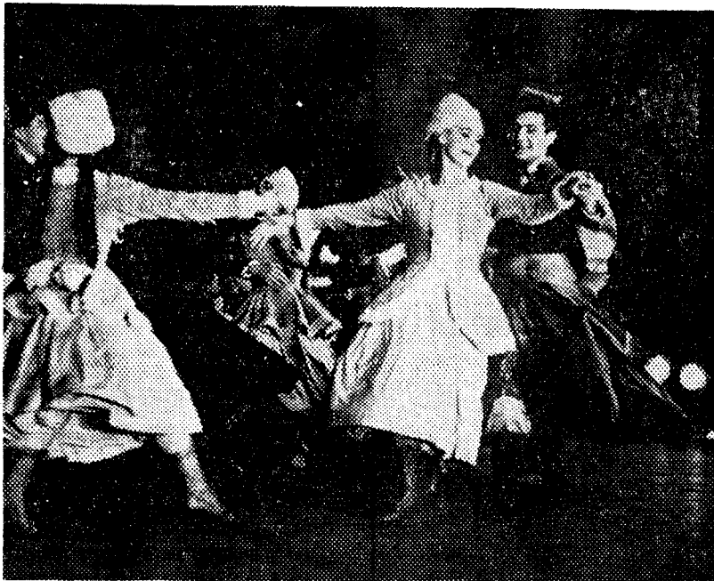
Uno de los cuadros coreográficos que presenta el Ballet Nacional de Polonia.

Veremos a Nureyev —que para el aficionado a la danza de escuela representa rendirse a una de las impresiones más intensas que puede despertar un bailarín en un escenario— como protagonista en los dos actos de «Giselle» y en «Monumento a la memoria de un muchacho muerto», que conocimos el año pasado en el repertorio del «Hark-