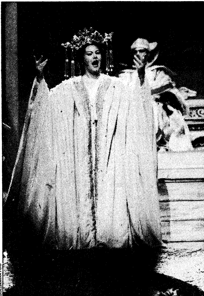
La atracción de lo exótico, manifestada en anteriores óperas de Puccini, vuelve a ponerse de relieve en "Turandot"

Turandot ordena que nadie duerma hasta que sea descubierto el nombre del extranjero. Calaf está seguro de su victoria. Liú, temerosa de hablar ante la tortura, se da muerte con una daga. El pueblo se lleva su cuerpo con profundo respeto. Calaf y Turandot quedan a solas. Pese a sus horrorizadas protestas, Calaf sucumbe a sus sentimientos hacia Turandot. A ésta le ocurre lo mismo respecto a Calaf. Cuando rompe el alba, el extranjero revela su nombre: Turandot y Calaf se presentan ante el emperador. Ella declara que conoce la identidad del joven: su nombre es Amor.