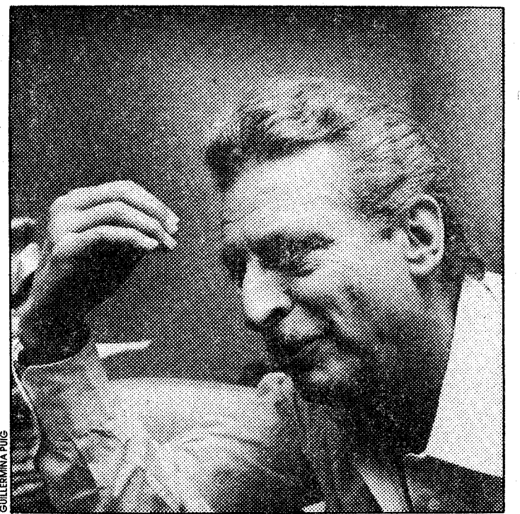
Alfredo Kraus, un tenor excepcional

¿Hay crisis de voces? "Hay una decadencia enorme en los maestros de canto, y un gran despiste, una falta de conocimientos. Yo no soy maestro de canto. Si ellos saben más que yo, y me lo explican y me convencer, yo acepto. Por egoísmo, incluso. Porque si a mí me viene alguien y me demuestra que lo que yo hago todavía se puede hacer mejor y más fácilmente, yo encantado, porque va a ser en beneficio mío. Entonces, sí, como yo creo —y lo creo honradamente—, puedo aportar a los