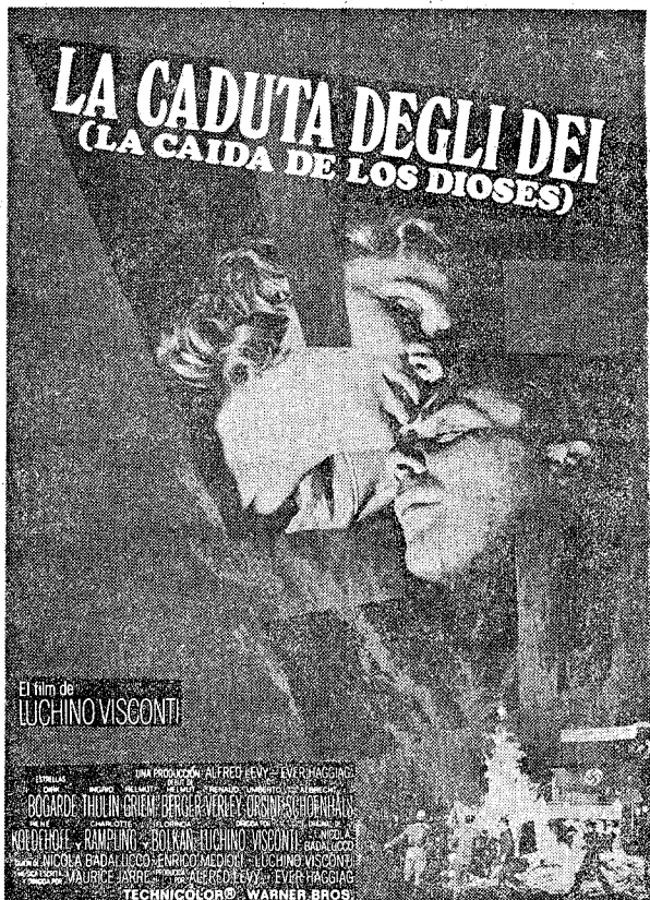
V. O. SUBTITULADA

¡Medio año del filme más comprometido y polémico de Luchino Visconti!