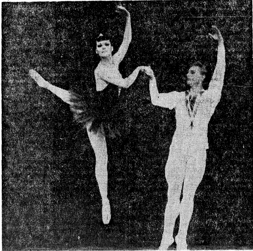
Kaleria Fedicheva y Jury Soloviev, protagonistas de los más famosos «pasos a dos» del ballet de Leningrado

intérpretes principales, que son los catorce clasificados como primeras figuras que encabezan el cartel y que se turnan en los «rois» protagonistas de los diferentes ballets. No citaremos ningún nombre que nada aclararía; todos son desconocidos para nosotros y sin duda darán lugar a muchas sorpresas.