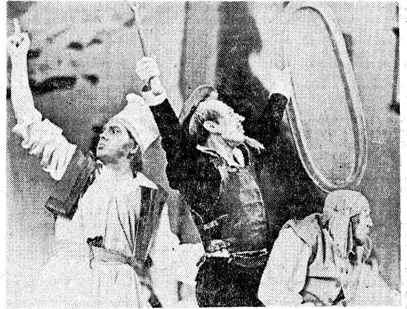
Las primeras figuras del ballet Kirov, en la escenificación completa de «Don Quijote», de Minkus

El equipo de ópera y ballet del Teatro Kirov está formado por unos 150 elementos. Más de la mitad vendrán para las representaciones de Barcelona. Entre ellos encontraremos nueve primeras figuras femeninas y cinco masculinas. No se habla en esta compañía de «estrellas», sino de