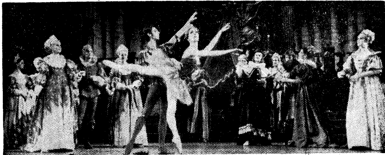
Montaje tradicional para el más tradicional de los ballets de Tchaikowsky: «La bella durmiente del bosque»

(Información facilitada por la AGRUPACIÓ CULTURAL FOLKLORICA BARCELONA)