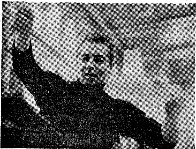
Karajan en un ensayo

Al lector probablemente le interesará más conocer lo que se prepara para los meses venideros que leer una más extensa evocación musical del año que hemos dejado atrás. El Liceo termina estos días la temporada de invierno. Como es sabido hoy se representa en nuestro primer teatro «Aida»; para el sábado día 13, está prevista la reposición de «Tristán e Isolda»; para el jueves, día 18, la de «Marina»; y para el martes, día 23, la última ópera de la temporada, una «Salomé» sensacional por tener una protagonista de excepción: la soprano finlandesa Anja Silja, que sin duda es una de las más fuertes perso-