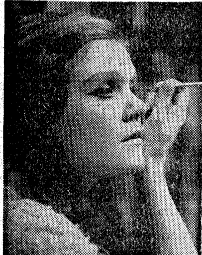
Anja Silja, en el camerino del Liceo

Al lector probablemente le interesará más conocer lo que se prepara para los meses venideros que leer una más extensa evocación musical del año que hemos dejado atrás. El Liceo termina estos días la temporada de invierno. Como es sabido hoy se representa en nuestro primer teatro «Aida»; para el sábado día 13, está prevista la reposición de «Tristán e Isolda»; para el jueves, día 18, la de «Marina»; y para el martes, día 23, la última ópera de la temporada, una «Salomé» sensacional por tener una protagonista de excepción: la soprano finlandesa Anja Silja, que sin duda es una de las más fuertes perso-