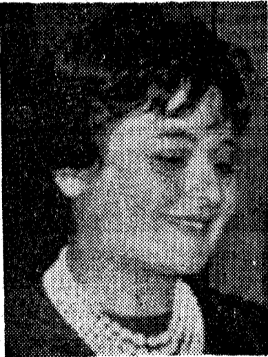
Victoria de los Angeles

El próximo Festival Internacional de Barcelona, que debe tener lugar en octubre, está prácticamente ultimado. Esperamos hablar del mismo más adelante, cuando los datos que sobre el mismo poseemos tengan una total confirmación. Podemos, pero, avanzar algunos: el Festival seguirá la tónica del anterior, aunque es posible que el número de